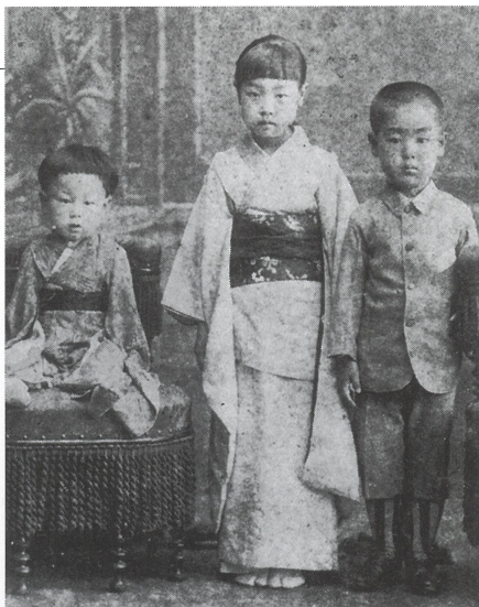
右、後に外交官となった兄の公共。 中、姉の伊嘉子。 左、幼き日の実篤。

武者小路実篤は明治十八年、東京市麹町区元園町（現・千代田区一番町）に生まれまし た。武者小路家は、公家と呼ばれる家柄で、 明治時代には子爵という位をいただいでいま した。