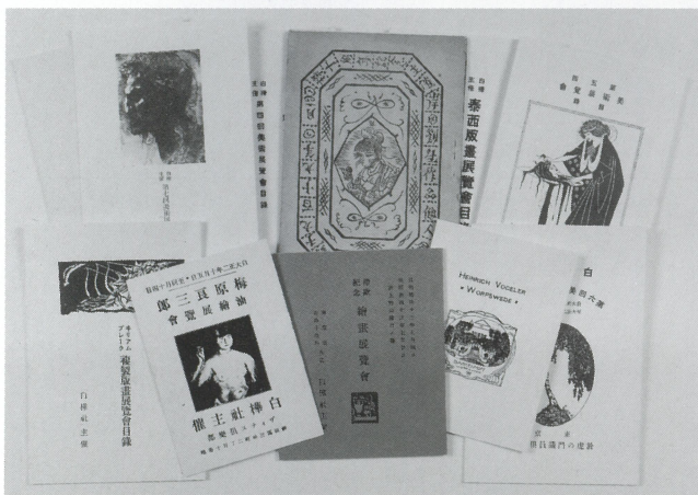
『白樺』が主催した美術展覧会は18回に及んだ。これはそのパンフレット。

芸術の力を尊重しようという『白樺派』の考え方は、今日でこそ、当たり前のことのようになりましたが、大正時代には、新鮮なものとして受けとめられました。教育の世界でも『白樺』の精神を生かそうとする実践活動が広まりました。