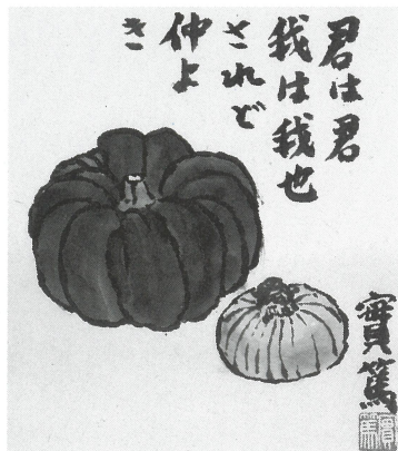
野菜図「君は君…」 昭和35～40年 実篤は、論語にある「和して同ぜず」という言葉なども好んで書いた。