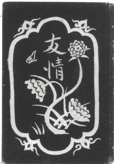
『友情』初版本(大正9年 以文社) 装幀は岸田劉生。

「友情」の主人公は二十歳を少し過ぎた野島という青年。劇作家を志す素朴で誠実な、また、一途なところのある若者です。彼には、大宮という親友がいます。すでに小説家として世に知られはじめている人物でした。二人はお互いに相手の人柄や才能を認め合っていました。野島は、少し年上で考え深く心情豊かな大宮から学ぶことが多く、よき友に恵まれたことを感謝しています。大宮も野島の人物を深く理解し、真の友情をもっていました。この物語の作者である実篤にも、学習院の中等科以来の友人、志賀直哉がいました。