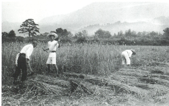
新しき村で 大正8年頃 中央が実篤 実篤は、誰もが平等で自分の個性を生かせる社会を実現しようと、大正7年11月、宮崎県に新しき村を創設。自らも会員とともに農作業を行った。

「友情」は、大正八年十月半ばから約二ヶ月、大阪毎日新聞に連載されました。実篤は、前年十一月、宮崎県に「新しき村」を開いたばかりで、農耕その他で忙しい日々を送っていました。この年、「幸福者」「耶穌」等の力作を次々と執筆。名作「友情」をも発表したのでした。