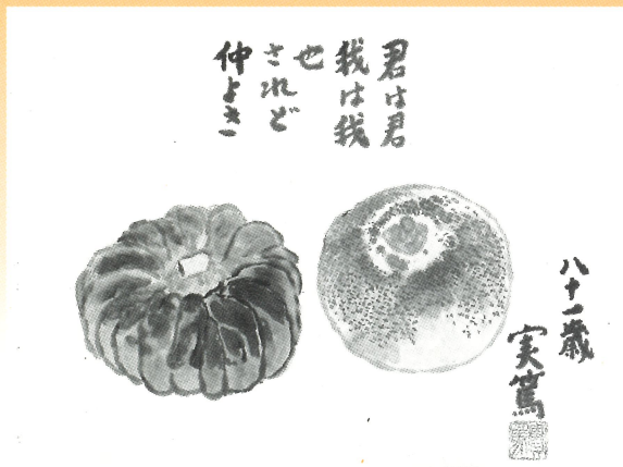
冬瓜と南瓜 昭和41年

絵に添えられた言葉には、自分も他人もお互いを大切にして、しかも親しいという、人間同士の理想的な関係が表されている。