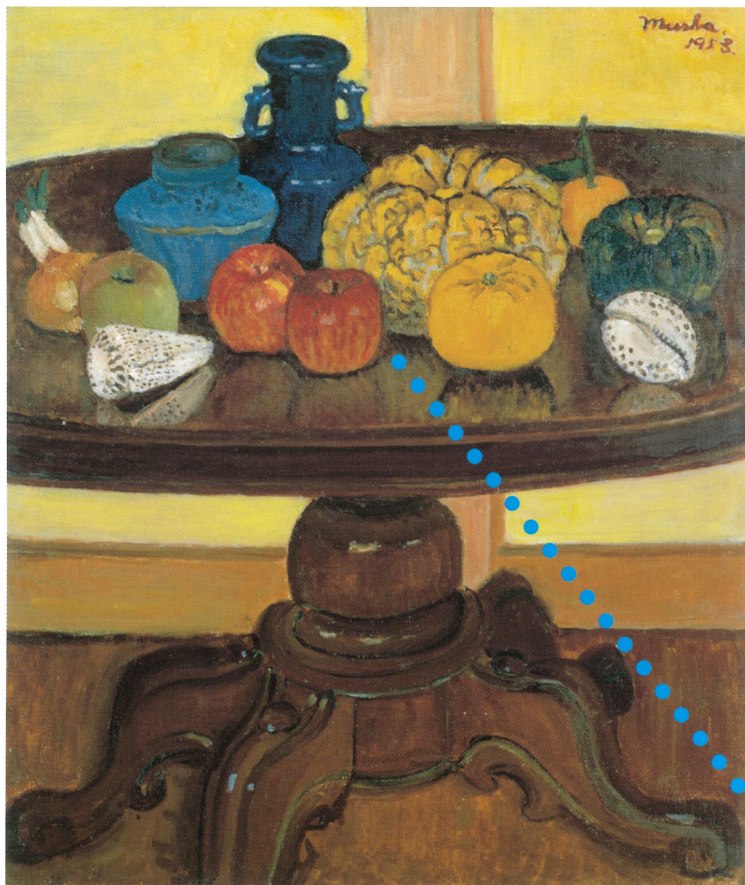
卓上静物 油彩 1953年