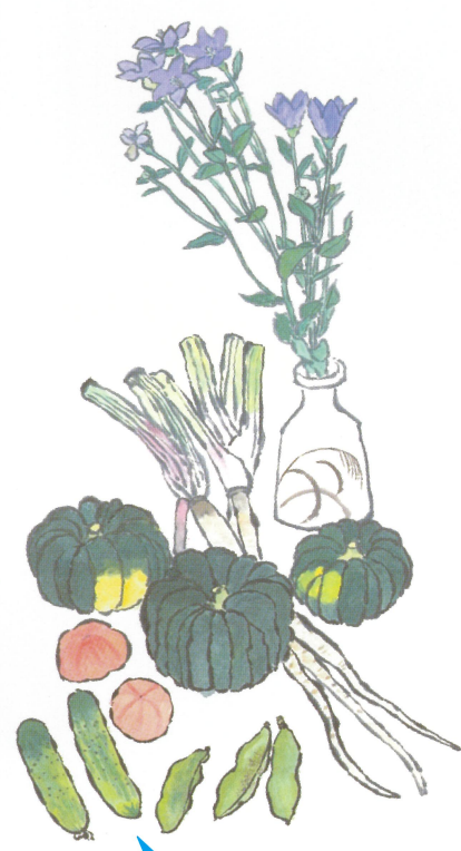
自然玄妙 淡彩 1950〜60年 實篤

しっぽ? いいえ、野菜にしっぽはありません。 つる? いいえ、つるについていたのはもう一方の先っぽ。 何だろう?