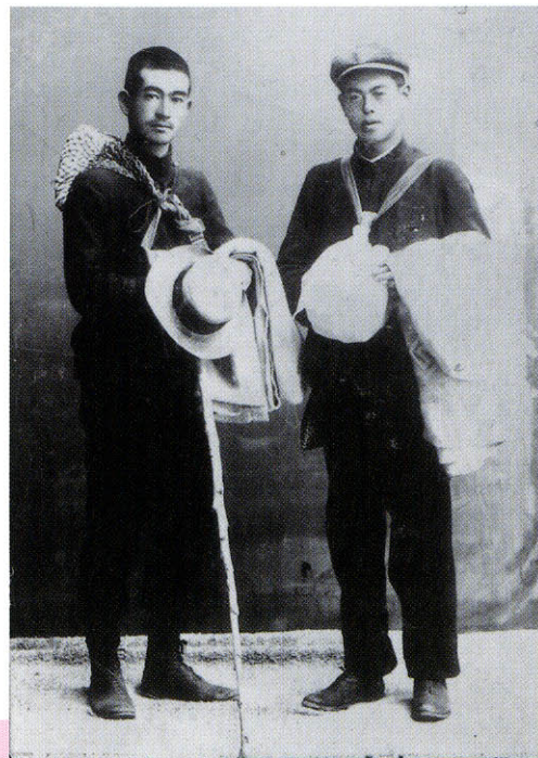
◆徒歩旅行記念写真 明治39(1906)年 富士山から赤城までを徒歩旅行し、二人のきずなを深めた。

◆実篤から志賀直哉あてのはがき 明治41(1908)年9月29日 この頃は、毎日のように会いながらも、さらに手紙を送っています。時にはけんかした二人。実篤が志賀に率直な気持ちを書いています。