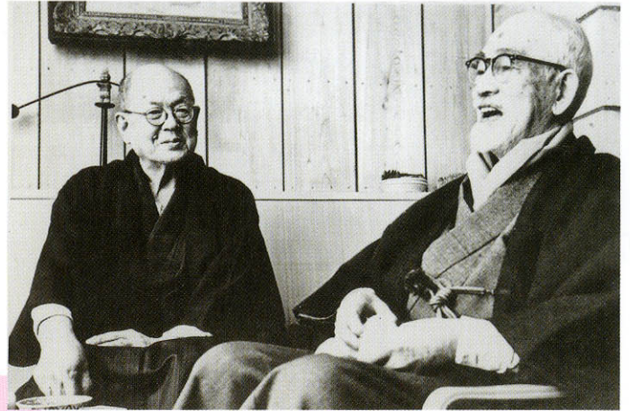
◆常磐松の志賀邸で 昭和38(1963)年 左：実篤(78歳)、右：志賀直哉(80歳)