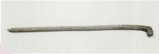
◆友情の杖 昭和38(1963)年 志賀直哉が実篤のために作った杖。

実篤と志賀は年をとっても親しくつきあい、互いを思いやる気持ちで結ばれている友だちでした。