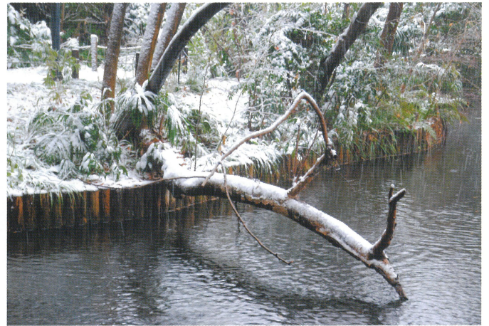
【冬】 雪景色になることも