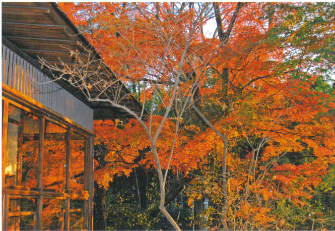
【秋】 紅葉がきれいです