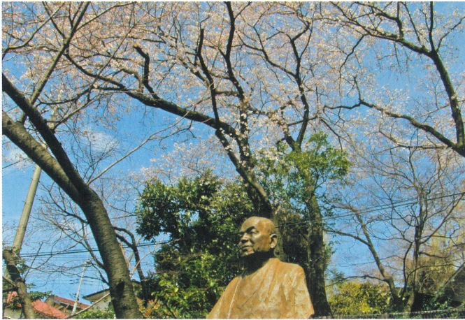
【春】 サクラが満開です