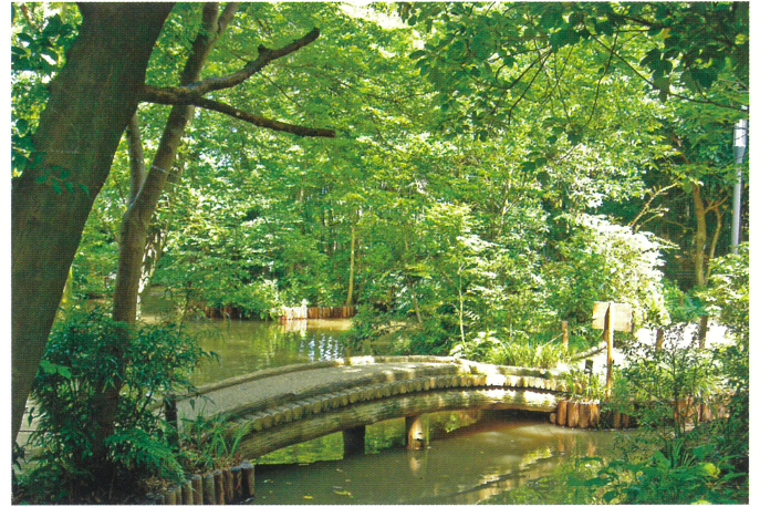
【夏】 緑がまぶしい季節です