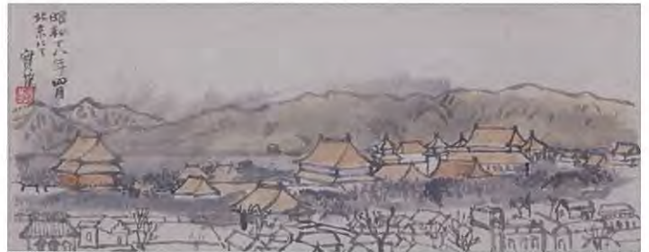
武者小路実篤「北京風景」(1943年) ※初公開